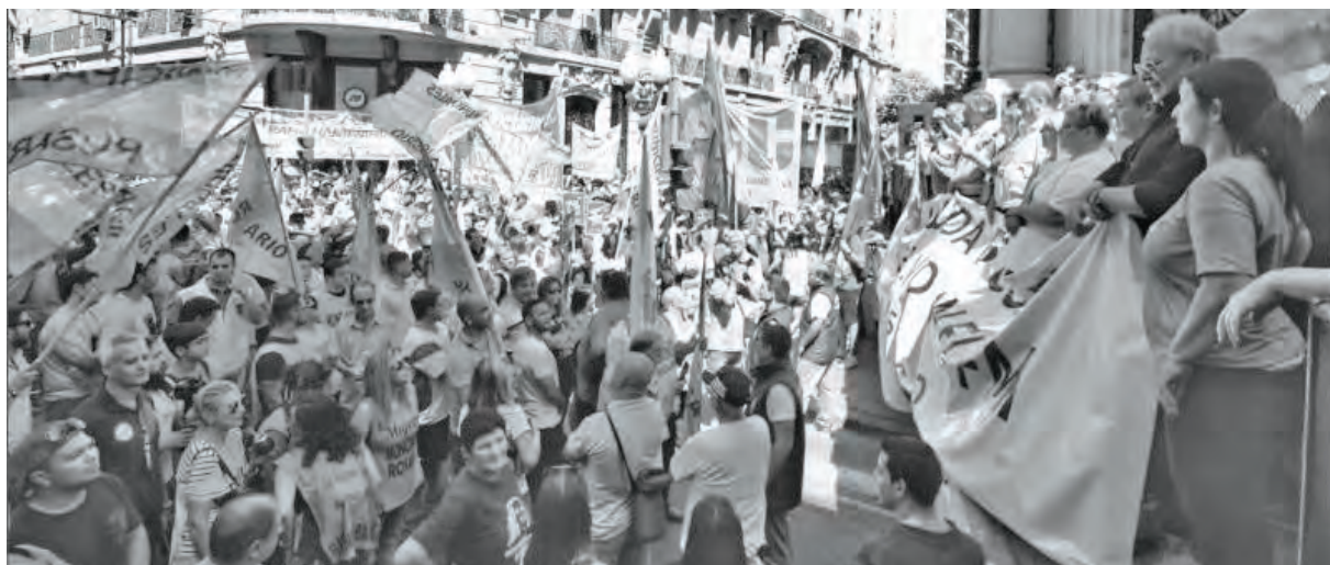
Vista de las dos marchas: una en apoyo al gobierno (arriba), la otra por el no pago (abajo)

Para enfatizar que la marcha fue en apoyo al gobierno el propio