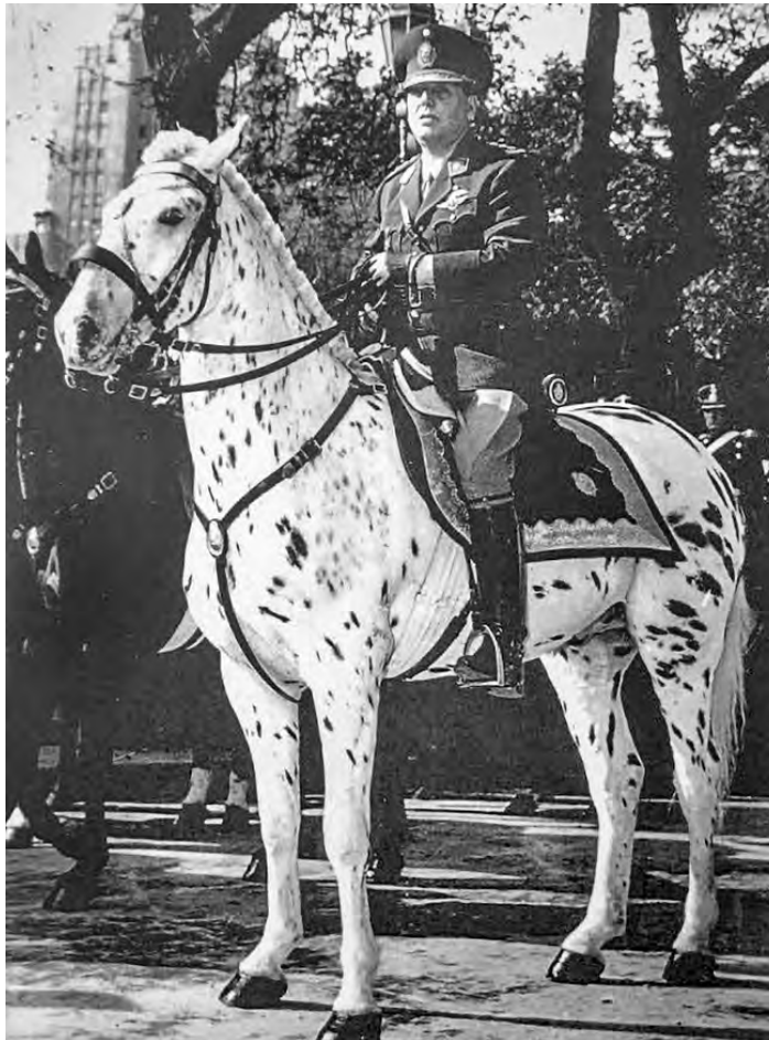
Perón en una de las fotos típicas de la época

Néstor primero y Cristina después “leyeron” correctamente el desafío del argentino. Se dieron la tarea de reconstruir el régimen político. Por eso ellos, que en la