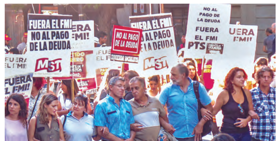
Cabecera de la columna hacia Plaza de Mayo

Esto demuestra la importancia por seguir fortaleciendo una alternativa política de los trabajadores y la unidad de la izquierda como lo venimos haciendo desde el FIT Unidad. Para seguir postulando una salida de fondo y dejar claro que ante la decisión de someterse a los dictados del FMI y del imperialismo por parte de Fernández con el apoyo de la oposición patronal, la salida alternativa viene por izquierda.