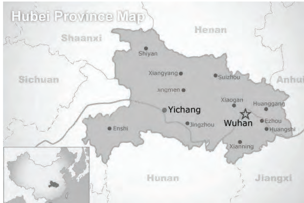
A la izquierda, la foto del doctor Wenliang que se viralizó en las redes sociales. A la derecha, la ubicación de Wuhan, ciudad donde comenzó la epidemia, capital de la provincia china de Hubei.

momento. También se comercializan zorros, murciélagos y serpientes. Se cree que algunos de estos animales pudieron haber transmitido el virus. Desde el gobierno chino han querido justificar estas prácticas, totalmente insalubres y que están prohibidas en muchas partes del mundo, como una cuestión “cultural” ancestral. Cuando en realidad este tipo de mercados, que se dan allí y en otras partes del mundo, son fruto de la miseria y la desigualdad de los pueblos. Una tradición que viene de las miserias y las hambrunas que genera la explotación capitalista.