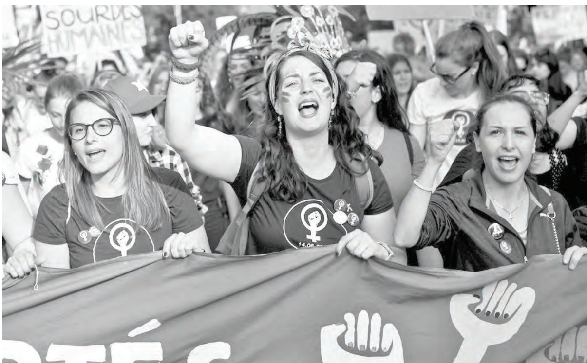
El 8 de marzo volveremos a estar en las calles por nuestros derechos

Históricamente, el 8M nació como una fecha para unir a las trabajadoras del mundo en su lucha por mejorar las condiciones de vida. Si nos remontamos a su origen, vemos a las obreras textiles de Nueva York que en marzo de 1908 salieron masivamente a las calles a exigir