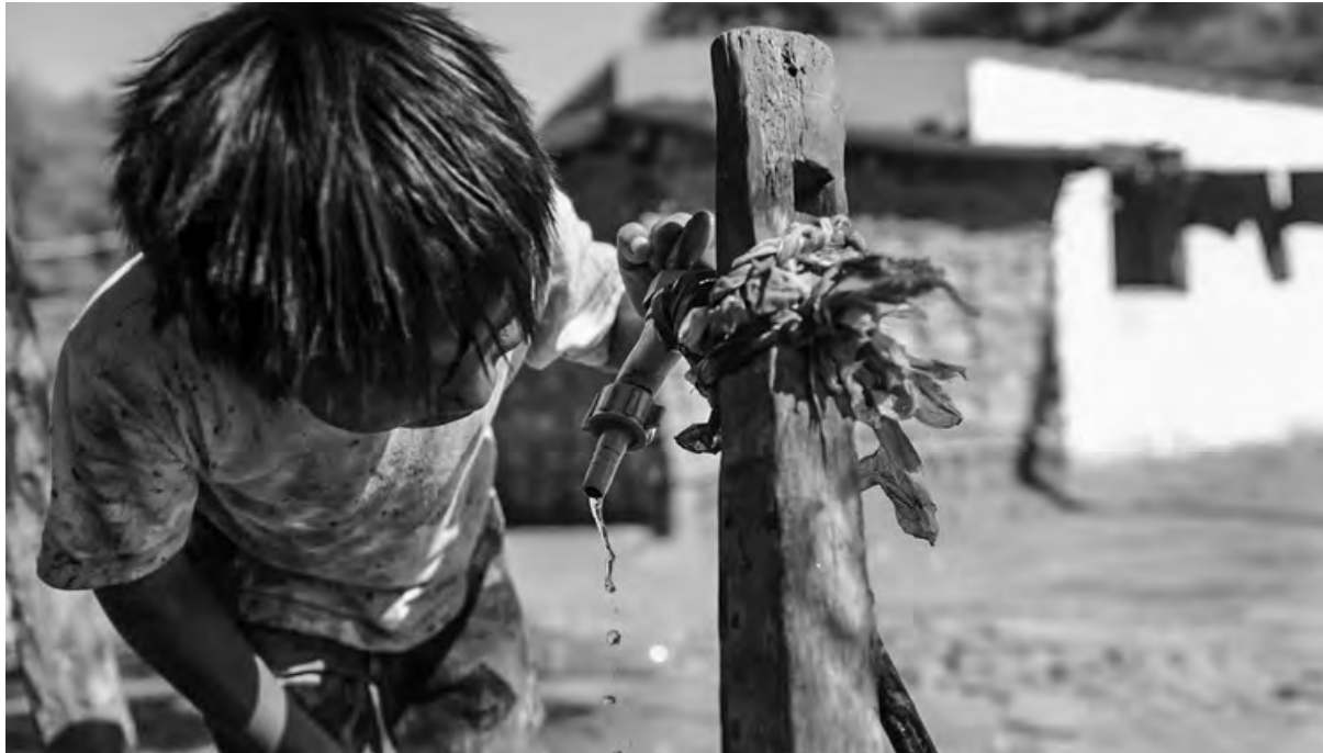
Los niños de los pueblos originarios son los principales damnificados

La comunidad wichí está distribuida en el norte del país, dispersa entre las provincias de Salta, Chaco y Formosa. En Salta, la provincia quizás con mejores recursos e infraestructura, los wichís vienen sufriendo las peores consecuencias de la marginación a la que siguen sometidos los pueblos originarios. La desidia gubernamental y el hambre se han cobrado la vida de ocho niños en Salta, provincia donde, durante el periodo 2007-2019 gobernó el peronista Urtubey, uno de los voceros preferidos de la Iglesia Católica y de los mayores terratenientes de su provincia, hombre fuerte de la Sociedad Rural.